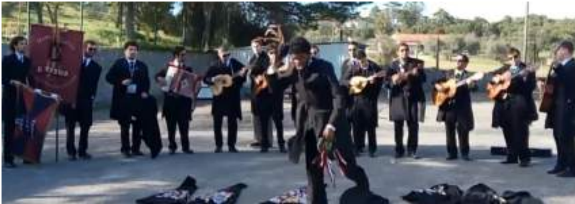
| Primeira tuna masculina na Universidade de Évora |

Grupo Académico Seistetos | Igreja de São Francisco, na rua da República